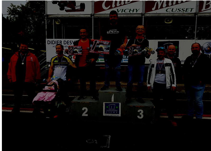
Classement Final - FFVRC-CF-MOTO OPEN B. [Moto Open B. CF]