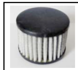
N° 5 Filtre