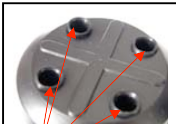
N°2 vue de dessus partie mesurable