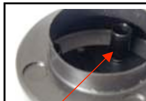
N°3 vue de dessous Partie mesurable