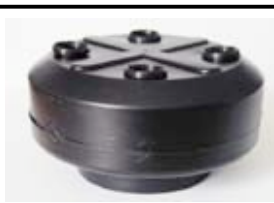
N°1 vue d'ensemble