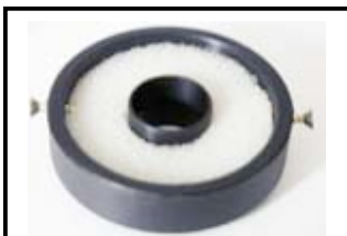
N°4 Bride moteur avec une mousse joint