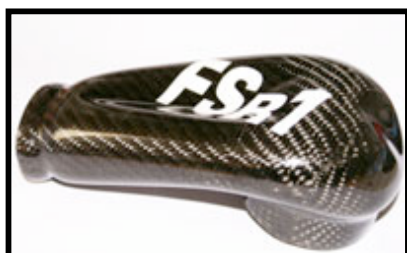
Figure N° 1 DESSUS