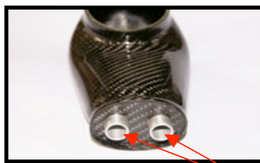
Figure N° 4 Parties mesurables