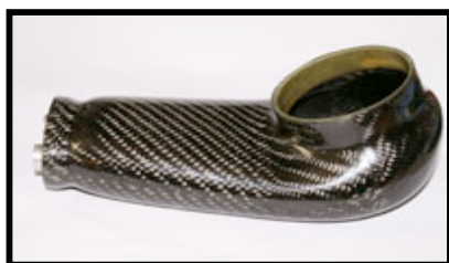
Figure N° 2 DESSOUS