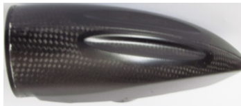
Fig.N °1 vue de dessus