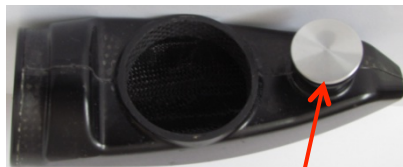
Fig. N°2 vue de dessous