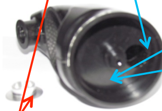
Fig. N° 4 insert fermant le dessous