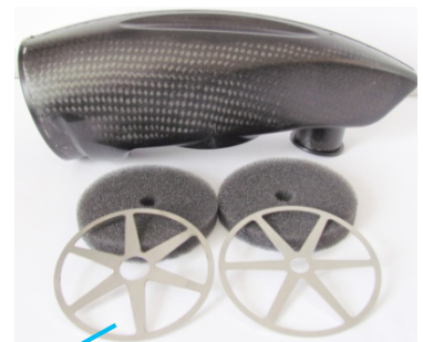
Fig N° 5 Filtration avant