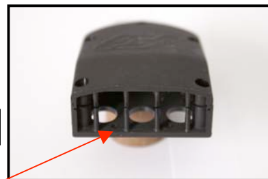
Fig.N°2 Vue Avant