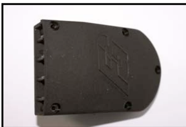
Fig. N°1 vue de dessus