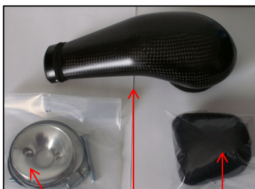
Fig N°1 vue d'ensemble Fixation carbu Boite Bonnette filtre