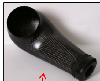
Fig N° 2 & 4 Vue de dessous