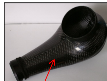
Fig N° 2 & 4 Vue de dessous