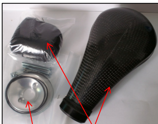
Fig N°1 vue d'ensemble Fixation carbu Boite Bonnette filtre