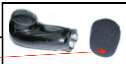
Fig N°2 Vue dessous Avec mousse