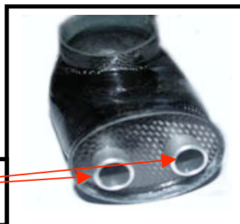
Fig :N°4 Parties mesurable