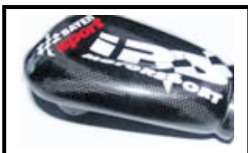
Fig N°1 Vue de dessus