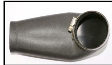
Fig N°5 Vue de dessous