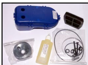
Fig. N°1 contenu de la boîte

CONSTRUCTEUR : Mielke Réf : 5201, ou Harm :1511671