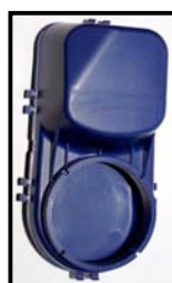
Fig. N°3 vue dessous