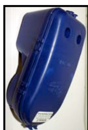
Fig. N°2 vue dessus