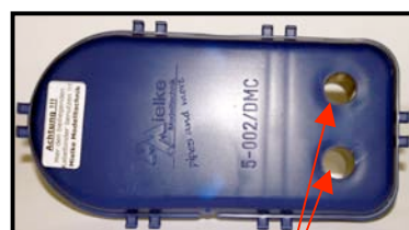
Fig. N°4 Entrée d'air