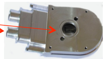
Fig. N°2 vue de dessous