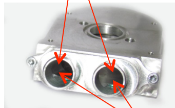
Fig. N°3 entrée d'air