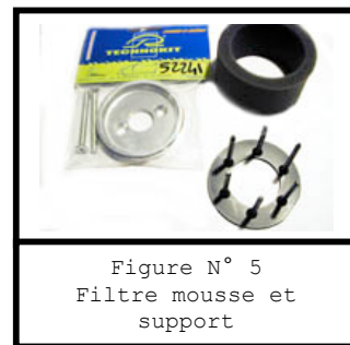
Figure N° 5 Filtre mousse et support