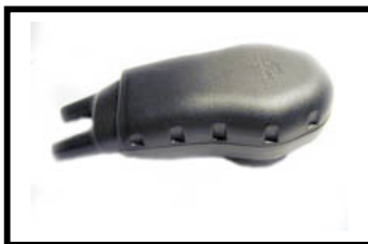
Figure N°1 Vue de dessus