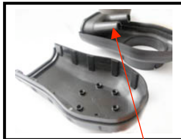
Figure N°2 Montage des entrées d'air à l'intérieur