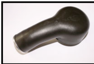
Figure N°1 Dessus