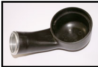
Figure N°2 Dessous