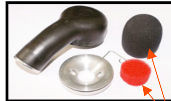
Fig: N°5 ensemble avec filtration