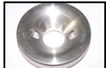
Fig: N°4 Bride de fixation conique