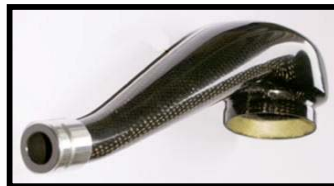
Fig : N° 2 vue trois quart arrière