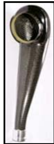
Fig: N°3 vue de dessous