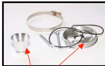
Fig :N° 5 BrideFixation carbu et cône entrée d'air