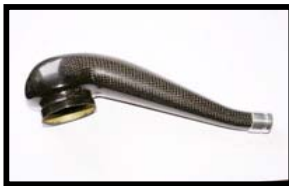
Fig N° 1 Vue de coté