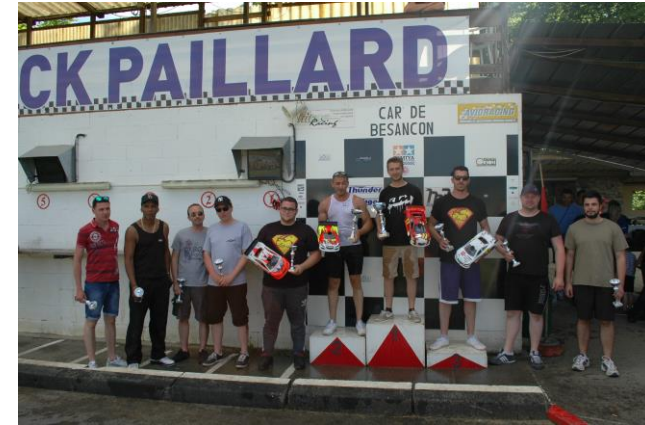
Les Finalistes Nationaux