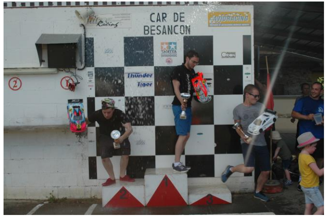
Le Podium et la Douche