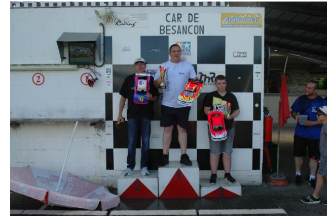
Le Podium 235mm