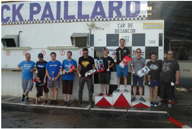
Les Finalistes Elites