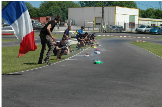
Départ Finale Nationaux

Pour terminer ce week-end, la remise des prix et des pôles position s'est déroulée, toujours sous un soleil de plomb, par des belles coupes et comme ils sont très joueurs à Besançon, quelques gamelles d'eau rafraichissante ont ponctuées cette remise de récompenses. Prochaine confrontation hormis le Championnat d'Europe de Mulhouse du 7 au 12 août 2017 sera la Coupe de France à Bourg en Bresse (Ligue 16) dès le vendredi après-midi 13/10, samedi 14/10 et dimanche 15/10.