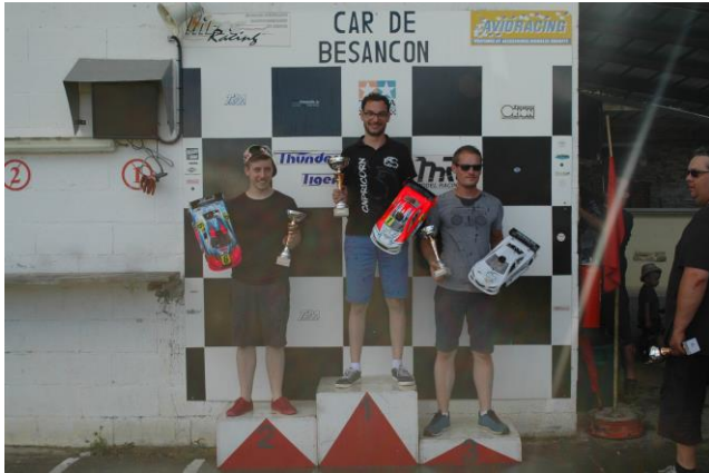
Le Podium Elites