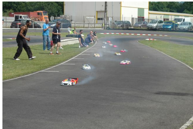
Départ Finale Elites