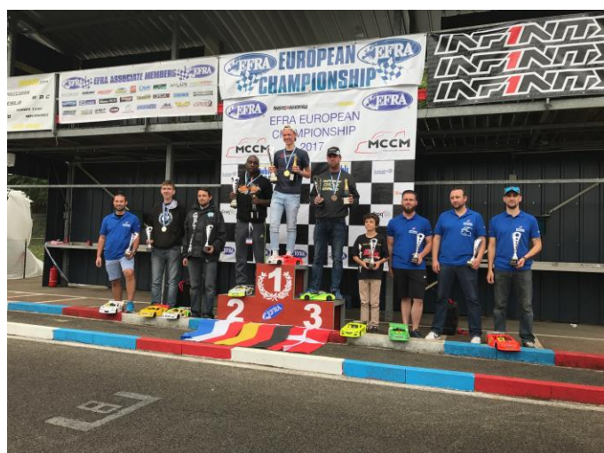
Le podium des finalistes Euro B