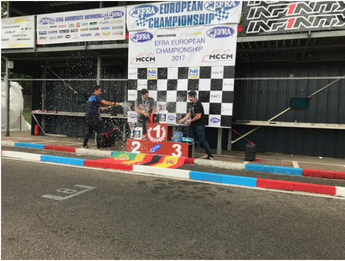
Le podium de cet Euro A