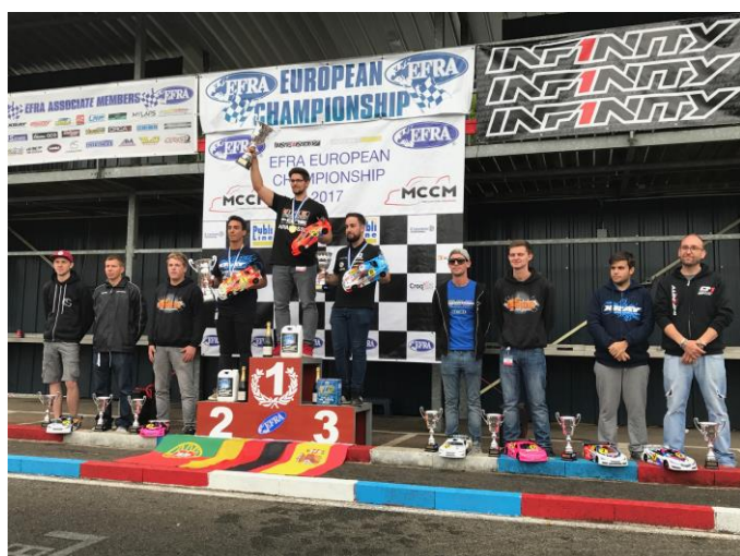
Le podium des finalistes Euro A