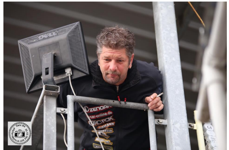
Le speaker Mr No More Laps