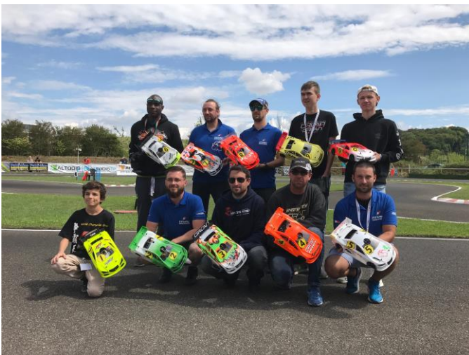
Les finalistes de l'Euro B