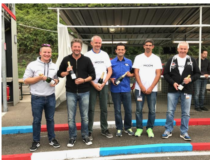
L'équipe qui dirige cet Euro