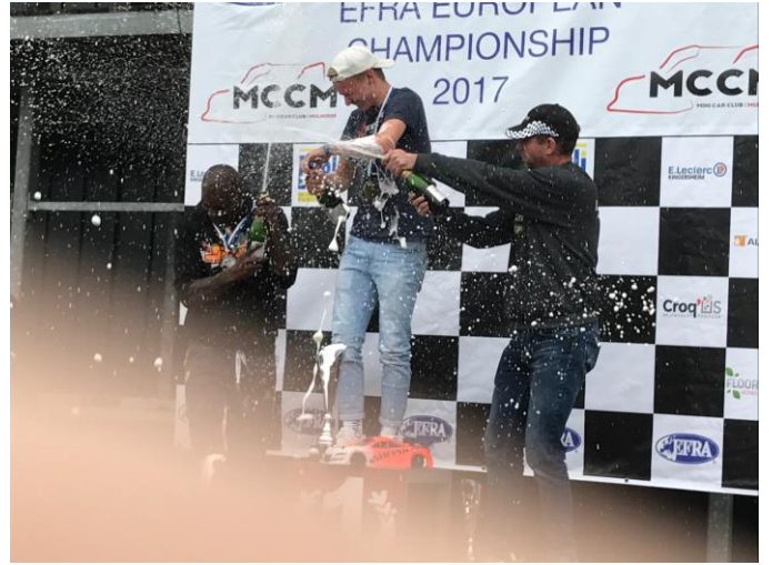
Le podium de cet Euro B