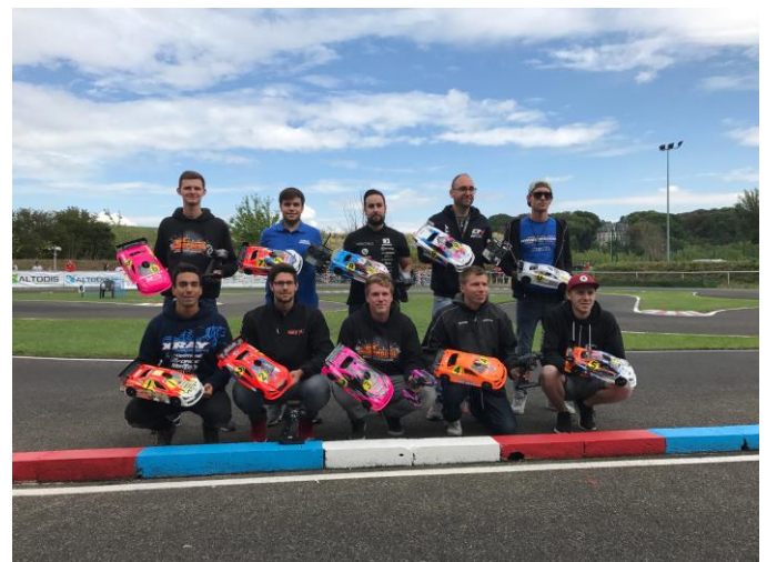
Les finalistes de l'Euro A