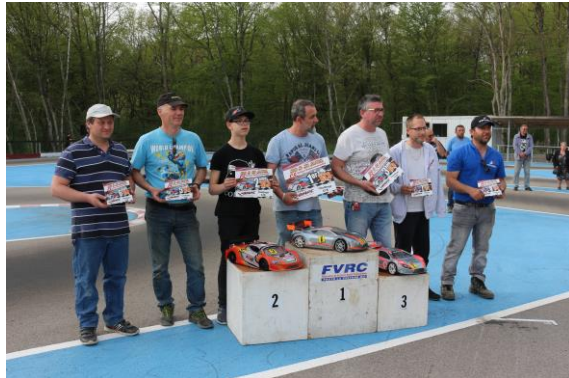
Finalistes GT8 BLS