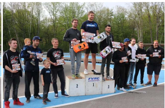
Les Finalites Elites