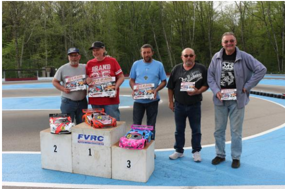
Finalistes GT8 Nitro