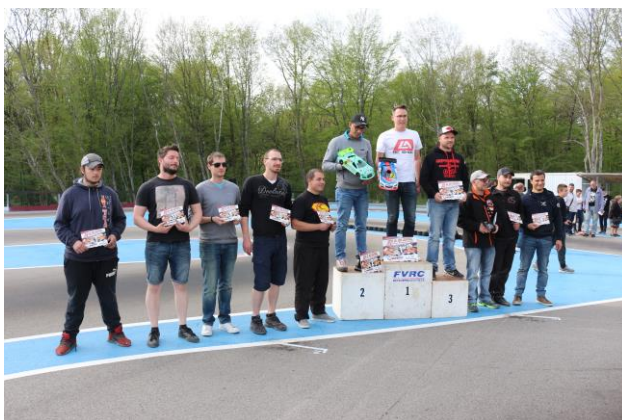
Les Finalites Nationaux