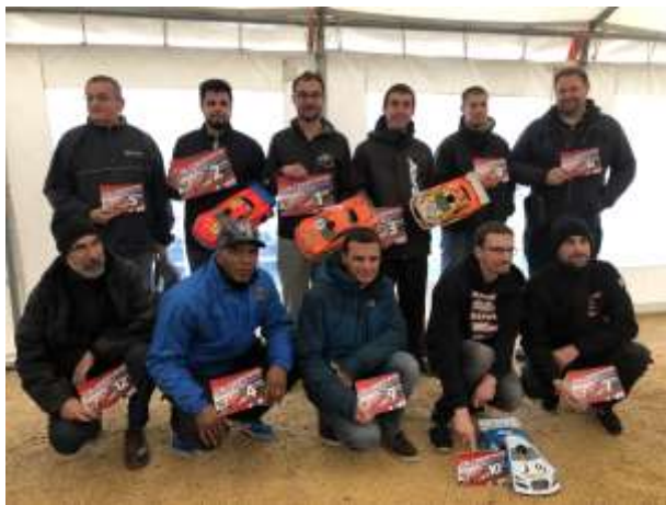
Les Finalistes de cette Coupe de France 2019