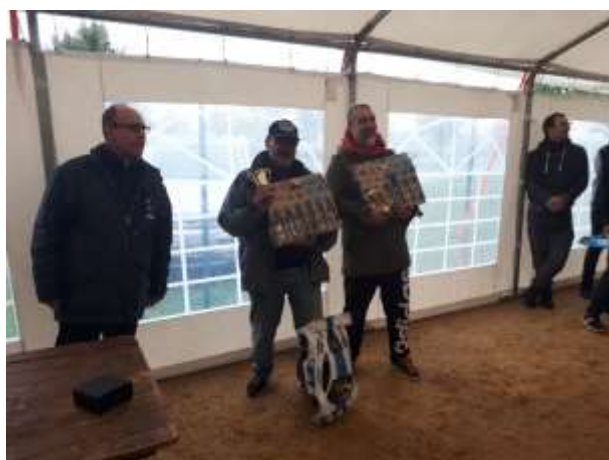
Les Vainqueurs 2019 du Challenge GT8

Prochain rendez-vous, l'année prochaine, en espérant que nous puissions revenir le deuxième week-end de chaque mois en même temps que la piste 1/8 ème afin de faciliter l'établissement des calendriers dans les régions. Début au mois de mars 2020. Tout cela sera confirmé après l'assemblée générale de l'EFRA et le Comité Directeur de novembre qui fixera et bloquera le calendrier et les lieux de course pour la saison 2020.