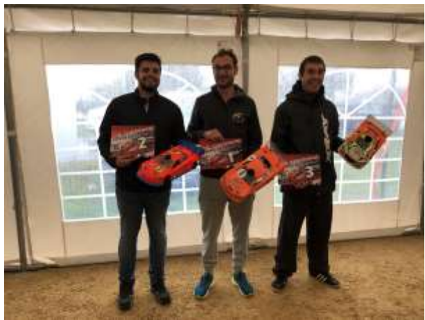
Le Podium de cette Coupe de France 2019