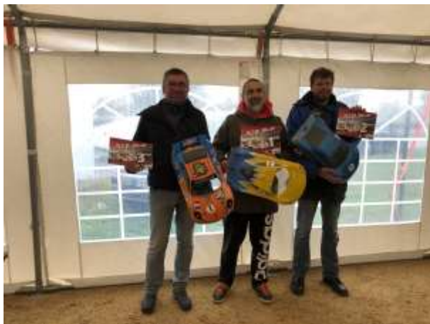
Le Podium GT8 BLS de cette Coupe de France 2019