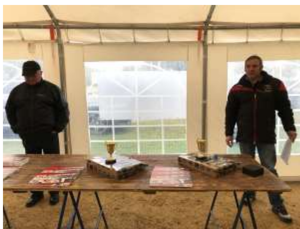
La remise des prix